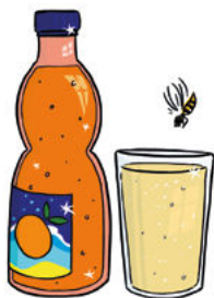
Limonade und Saft