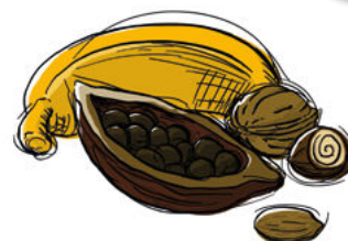
Bananen, Nüsse und Kakao