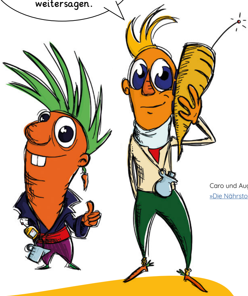
Caro und Augio aus »Die Nährstoffgeschichte«

Nährstoffe sind Superkräfte! Das muss ich gleich weilersagen.