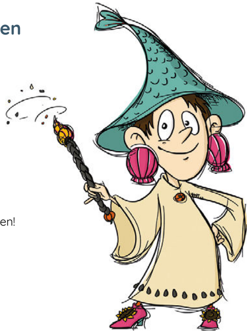
Zaubermeisterin Zinka aus »Die Nährstoffgeschichte«

Manchmal ergeben sich im Familienalltag ganz neue Formulierungen, Wörter und Fantasienamen! Greift sie auf und integriert sie in den Alltag. Sie sind oft ein schöner „Anker“ für Familiengewohnheiten.